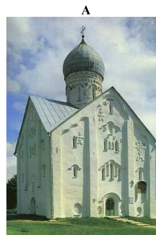
Церковь Спаса Преображения на Ильине улице